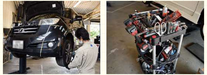
専用の設備や工具、豊富な専門知識で安心感UP